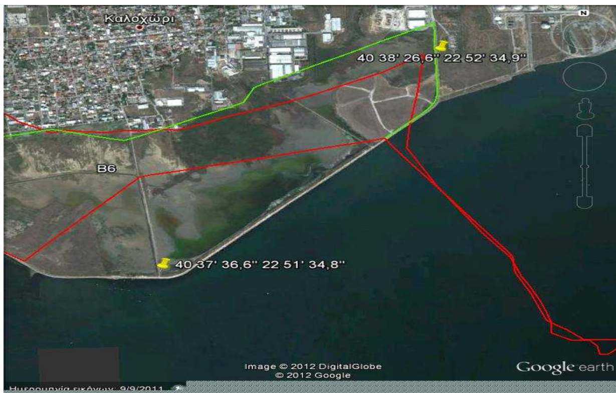
Εικόνα 4: Απεικόνιση της περιοχής παρέμβασης στο χάρτη