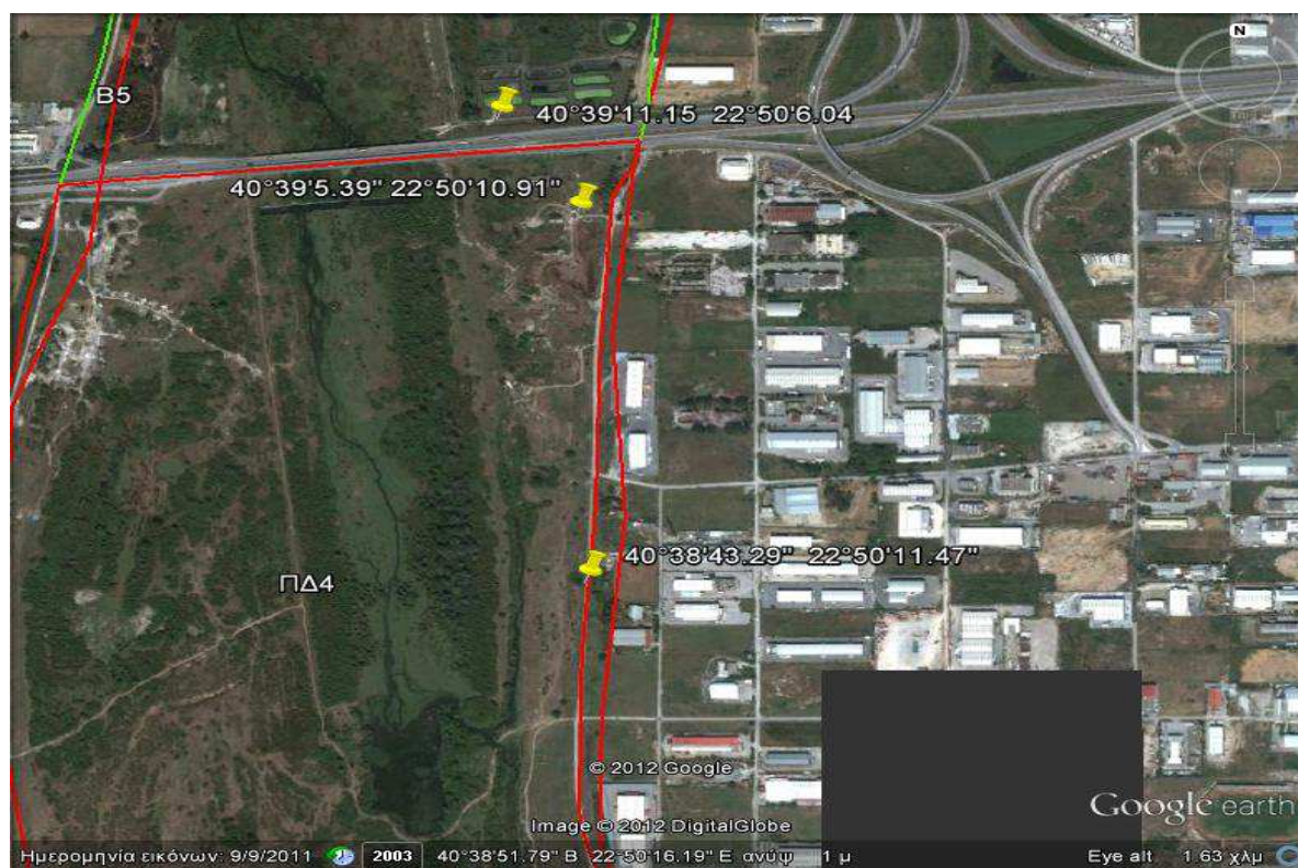
Εικόνα 3: Απεικόνιση της περιοχής παρέμβασης στο χάρτη

Συντεταγμένες (HATT): ΑΠΟ Γεωγραφικό Πλάτος : 40°38'43.29"Β Γεωγραφικό Μήκος : 22°50'11.47"Α ΕΩΣ Γεωγραφικό Πλάτος : 40°39'5.39"Β Γεωγραφικό Μήκος : 22°50'10.91"Α