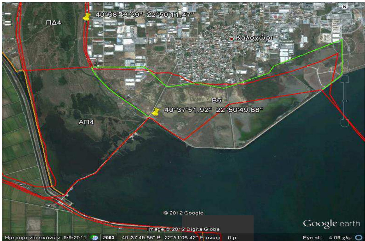
Εικόνα 4: Απεικόνιση της περιοχής παρέμβασης στο χάρτη

Γεωγραφικό Μήκος : 22^{\circ}50'49.68''\text{A}