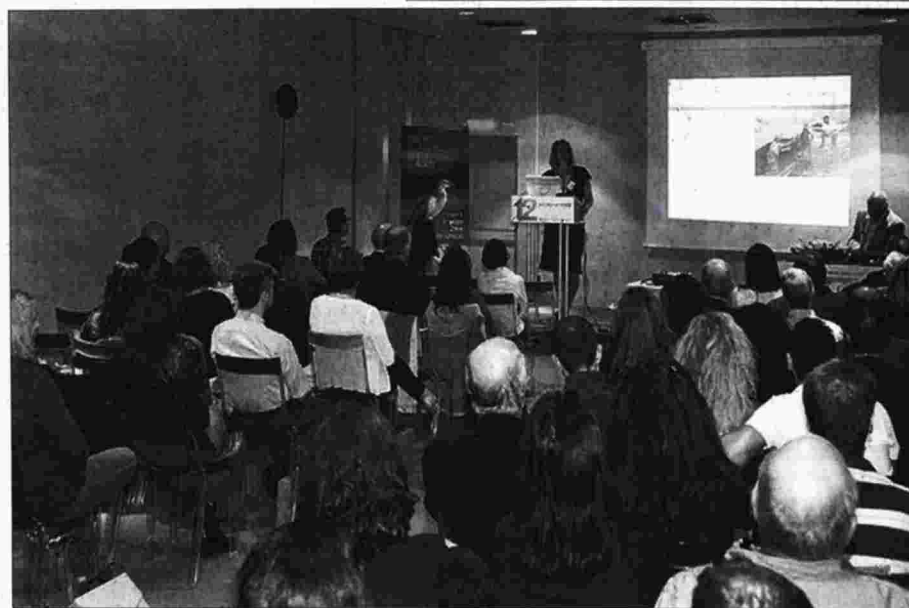
Αργυροπελεκάνοι στο Δέλτα Αξιού. Αριστερά: Το συνέδριο που διοργάνωσε ο Φορέας Διαχείρισης Δέλτα Αξιού - Λουδία - Αλιάκμονα

κολούθησης των υπόλοιπων ειδών πανίδας και κλωρίδας. Ενδεικτικά, οι ερευνητές των θηλαστικών διαπίστωσαν ότι στην περιοχή του εθνικού πάρκου ζουν 13 είδη νυχτερίδων, ενώ έως τώρα ήταν γνωστή η παρουσία ενός είδους.